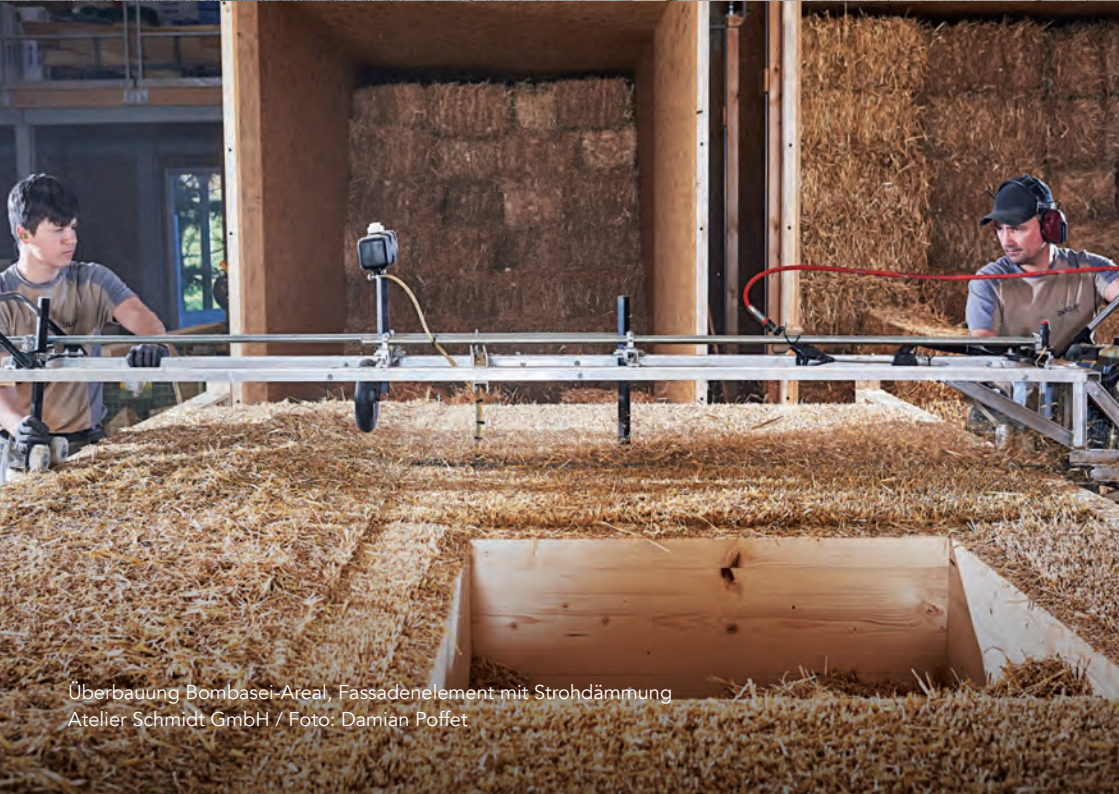
Überbauung Bombasel-Areal, Fassadenelement mit Strohdämmung Atelier Schmidt GmbH