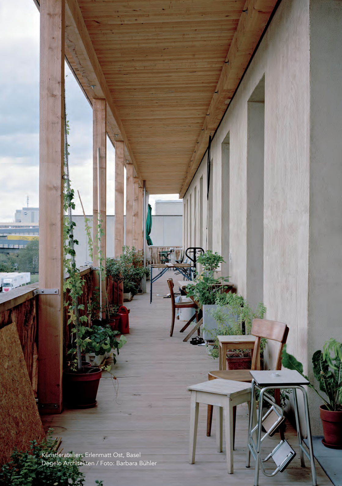
Künstlerateliers Erlenmatt Ost, Basel Degelo Architekten